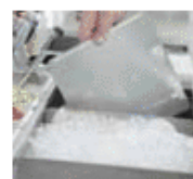
Separadores móviles incluidos