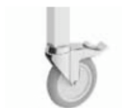
Kit ruedas KR4, como opción