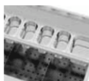
Opcional: Kit cubetas: KC-160