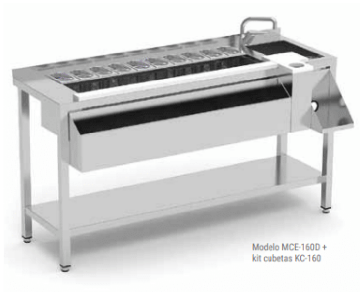
Modelo MCE-160D + kit cubetas KC-160